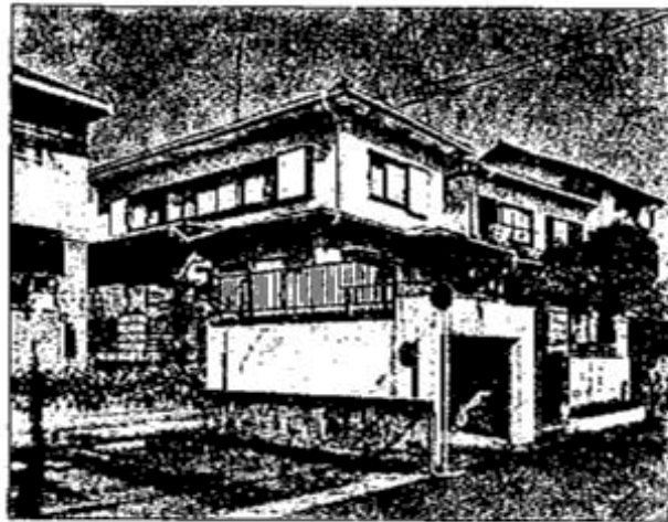
※撮影時期と現在では状況が異なる場合があります。